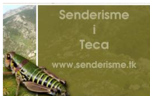
Senderisme i Teca

El món de l'excursionisme és molt actiu i ja ens mostra alguns serveis que hem de tenir en compte. Considerem alguns casos del nostre entorn geogràfic immediat: